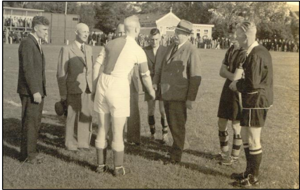
1940: ZFC is te gast op het 40 e verjaardagsfeest van ZVV

Toen in 1954 in Nederland het betaald voetbal werd ingevoerd, werd ZFC een semi-profclub. In 1958 werd het kampioen van de Tweede Divisie A, zodat promotie naar de Eerste Divisie werd afgedwongen.