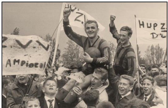
1962: ZVV viert het kampioenschap

Op 25 augustus 1900 werd de voetbalclub Hellas door een fusie met U.N.I. en de Wormerveersche Voetbal Vereniging Wormerveer onder een andere naam opnieuw aangemeld bij de N.V.B., namelijk: Zaanlandsche Voetbal Vereniging Z.V.V..